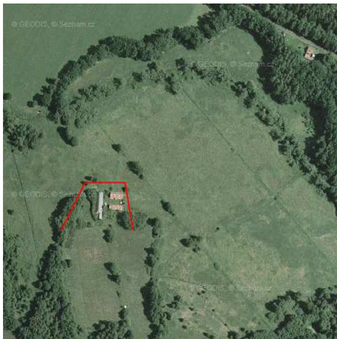
Obr. 2. – Možnost ochrany objektu bašta Petříkov zemní ochrannou hrází– podrobnosti viz studie